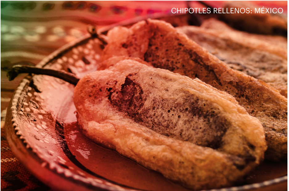
CHIPOTLES RELLENOS: MÉXICO

EN ESTADOS UNIDOS CON UNA COMUNIDAD LATINA TAN EXTENSA ESTAS RECETAS PARA CELEBRAR LA NAVIDAD SE VAN HACIENDO MÁS FAMOSAS ENTRE LAS COMUNIDADES.